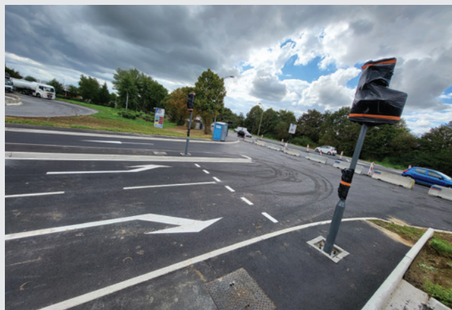
Le nouveau carrefour sera régulé par des feux tricolores.

Ce nouvel accès se situe à hauteur de la station-service E.Leclerc à la jonction entre la RM549 et le prolongement de la rue de l'Industrie, dans la zone Seclin-Unexpo. Grâce à une circulation régulée par des feux tricolores, ce nouvel accès propose une seconde sortie (sur deux voies) depuis la zone