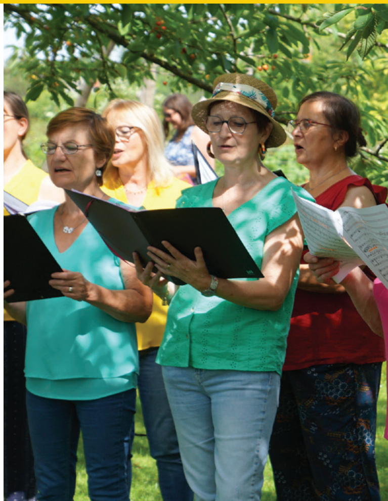
Utopia Lille 3000 : chants dans le jardin des cultures Mosaïc avec le CMEM.

À l'heure où vous lirez ces lignes, le maître d'œuvre de la transformation de la salle des fêtes en salle de spectacles aura été choisi et entériné par le Conseil Municipal de fin septembre. Sans pouvoir encore révéler le nom du groupement qui réalisera le projet (N.D.L.R : la date du bouclage de ce magazine ne nous permet pas d'en dire plus), le fait est que ce grand projet du