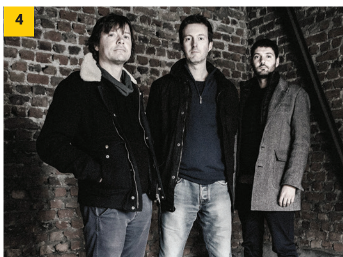
1 - Les Amants de Montmartre, le 8 octobre. 2 - Kiss Me Baby, le 2 décembre - 3 - Quintette Phénix, le 6 décembre - 4 - Avignon au Trianon avec Espace Impair, le 16 décembre.