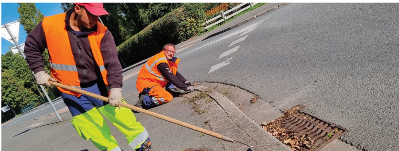
Les employés d'Interval (ici sur la photo) travaillent dur pour désherber à la main.